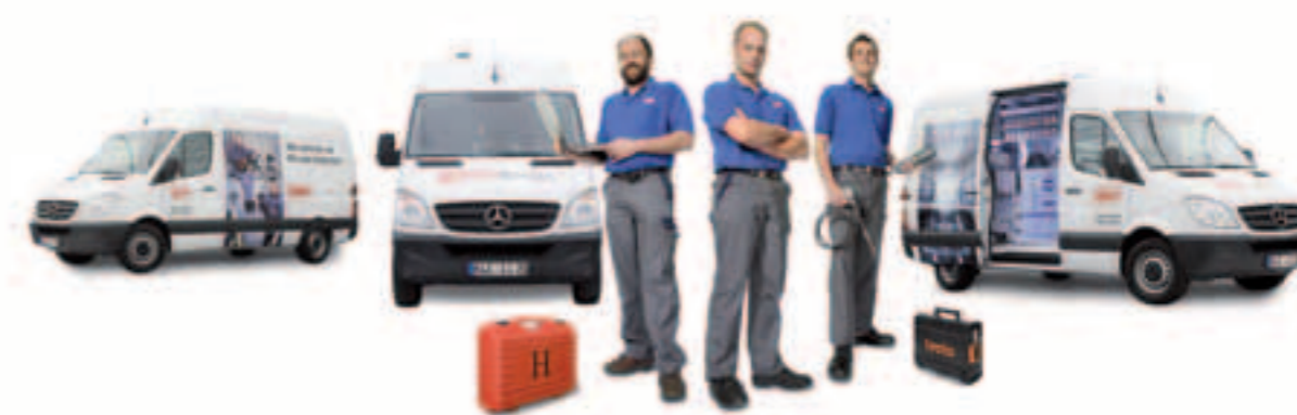
Immer dabei: Eine Auswahl wichtiger Verschleißteile wird in unseren Servicewagen mitgeführt.