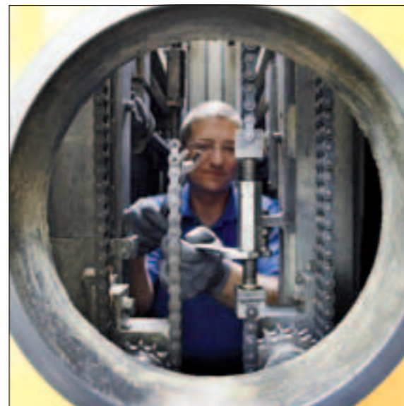
Wartung der Türmechanik in einer Vakuumofenanlage.

Das heißt, wir sorgen dafür, dass Ihnen jeder Ipsen Ofen niedrige Betriebskosten, eine konstant hohe Betriebssicherheit bei minimiertem Ausfallrisiko und eine lange Lebensdauer bietet. Nicht zuletzt mit Wartungsverträgen, die individuell auf Ihre Ansprüche zugeschnitten sind.