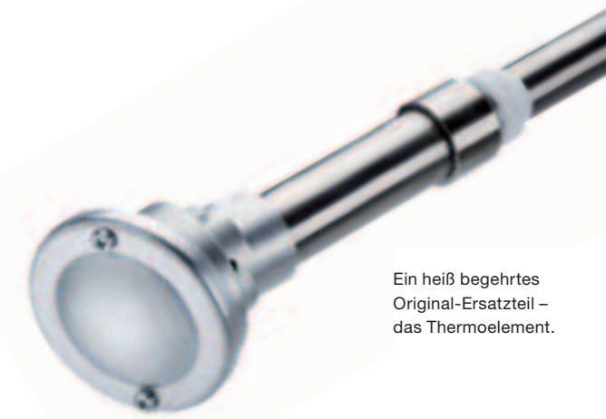
Ein heiß begehrtes Original-Ersatzteil – das Thermoelement.

Wir lassen Ihre Mitarbeiter gern an unserem Know-how teilhaben. Sowohl was das Grundlagenwissen der Wärmebehandlung betrifft als auch die detaillierten Kenntnisse zur Prozesstechnik sowie zur Bedienung und Wartung einer Ipsen-Anlage. Und – wir beraten Sie in allen Fragen zur Verfahrenstechnik und rund um den Betrieb einer Ipsen-Anlage.