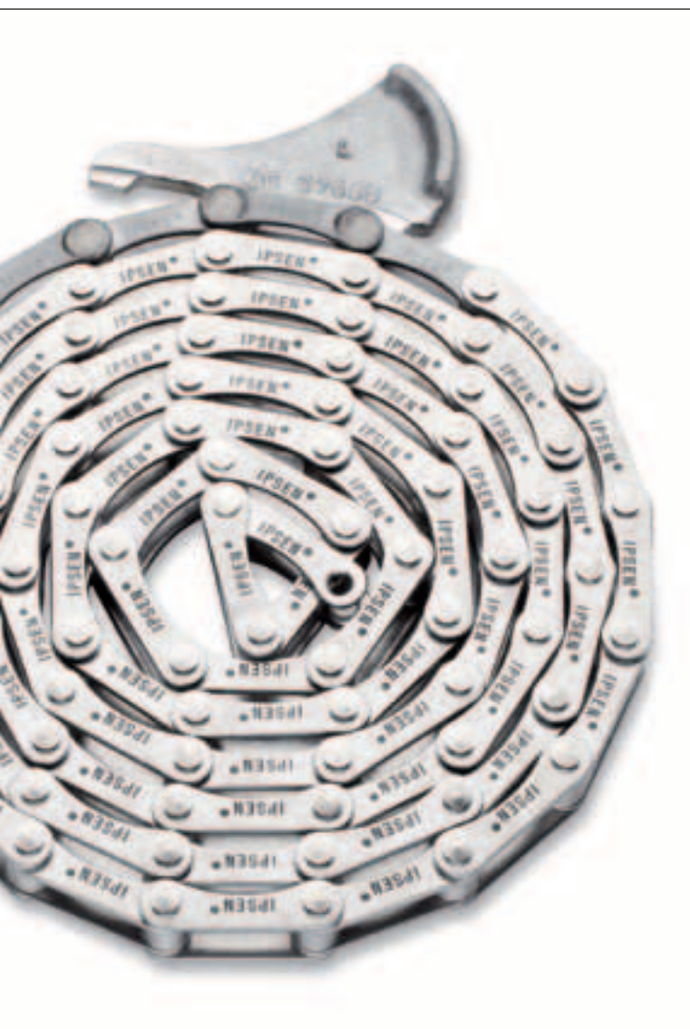
La catena universale rinforzata per lotti con un peso fino a 2 t

Anche questa catena universale è saldata ed è costituita da una parte fredda e una calda. Grazie alla sua struttura robusta può essere utilizzata per lotti con un peso fino a due tonnellate.